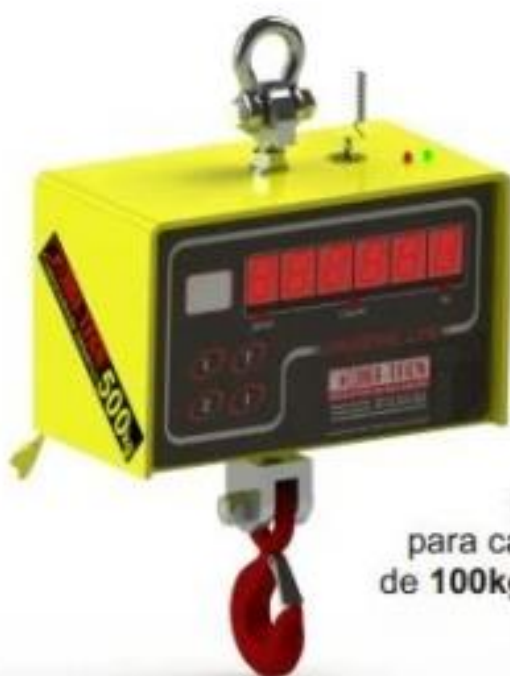
Balança Suspensa para capacidade de 100kg à 500kg