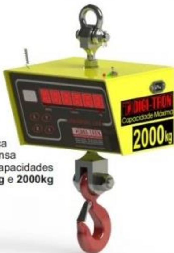
Balança Suspensa para capacidades 1000kg e 2000kg

Possuem Leds indicativos de carga da bateria e tomada externa para carregamento. Display em Led Vermelho Pintura Epóxi.